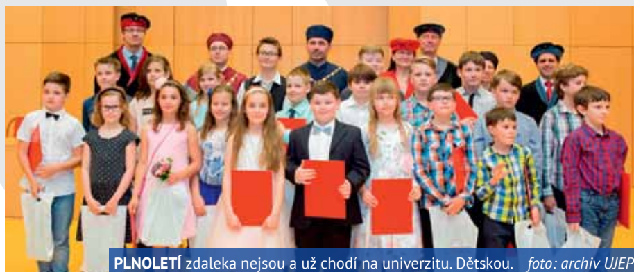
PLNOLETÍ zdaleka nejsou a už chodí na univerzitu. Dětskou.

družství barvy“ byly děti vtaženy do tajů výroby mýdla a své vlastní mýdlo si také vyrobily. V přednášce „Ferda by se divil“ děti poznaly nelehký život mravenců. Kreativitu projevily i v kurzu „Hrátky s LED diodami“ či „Kov + korálky = šperk“, kde si vytvořily vlastní elektronický výrobek a vlastní náramek. Společně s lektorem dobyly Divoký západ a Vikingem Olafem se zase nechaly pozvat do jeho globální vesnice. Slavnostní promoce se konala za účasti rodičů, prarodičů, kamarádů, ale také některých učitelů ze základních škol.