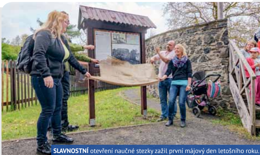
SLAVNOSTNÍ otevření naučné stezky zažil první májový den letošního roku.

TO JE NÁZEV NOVÉ NAUČNÉ STEZKY, KTERÁ NAVAZUJE NA JIŽ STÁVAJÍCÍ TRASU VĚTRUŠE – VRKOČ.