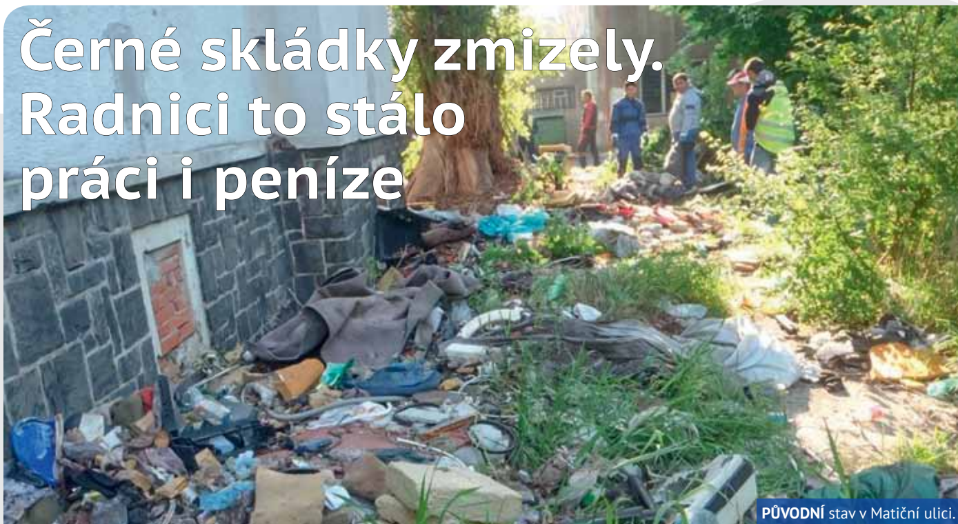
PŮVODNÍ stav v Matiční ulici.

V LOŇSKÉM ROCE PŘIŠLA LIKVIDACE ČERNÝCH SKLÁDEK NEŠTĚMICKÝ OBVOD NA PŮL MILIONU KORUN.