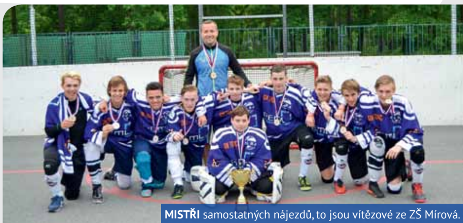
MISTŘI samostatných nájezdů, to jsou vítězové ze ZŠ Mírová.

SPORTOVNÍ DĚJINY ZŠ MÍROVÁ V ÚSTÍ NAD LABEM BYLY PŘEPSÁNY. ÚSPĚŠNĚ.