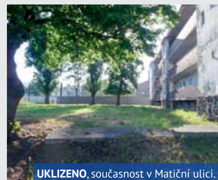
UKLIZENO, současnost v Matiční ulici.