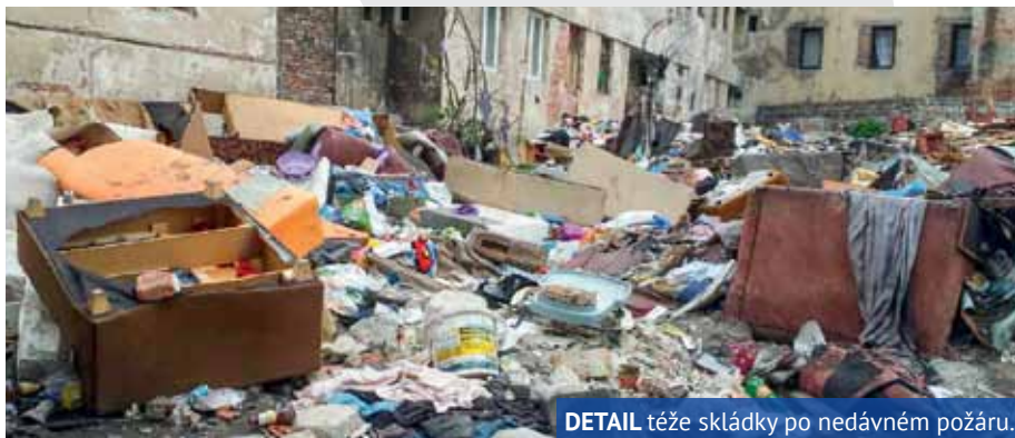
DETAIL téže skládky po nedávném požáru.