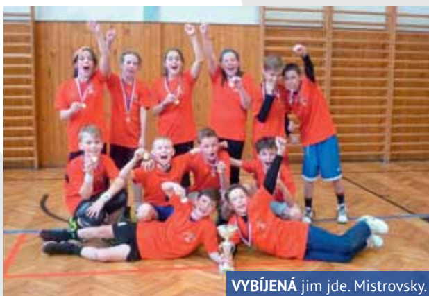
VYBÍJENÁ jim jde. Mistrovsky.

asi zástupci naší malé školy dopadnou. Všechny zápasy jsme vyhráli, největší sportovní zápolení bylo se základními školami z Mostu a Teplic, a kvalifikovali jsme se na celorepublikové finále. Do konce školního roku nás čekají ještě celoškolní atletická olympiáda, míčové hry střekovských škol, soutěž ve šplhu a sportování s rodiči.