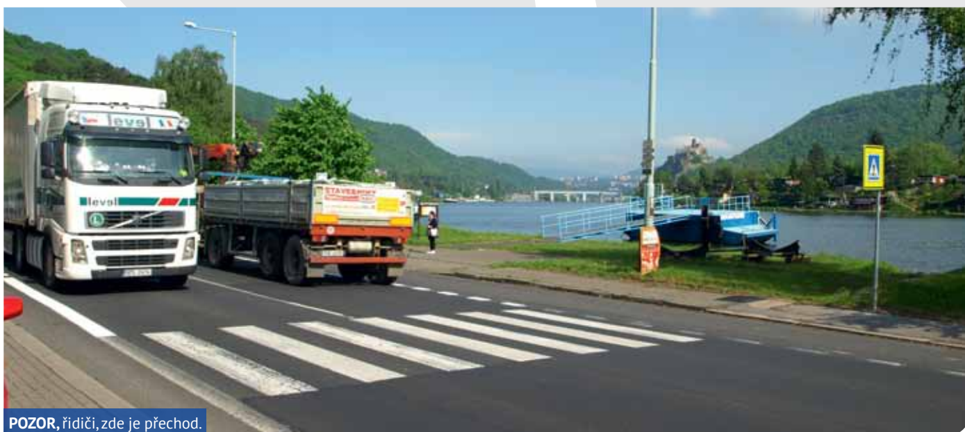
POZOR, řidiči, zde je přechod.

za pracovní skupinu PaedDr. Petr Brázda, KSČM, zastupitel města Ústí nad Labem