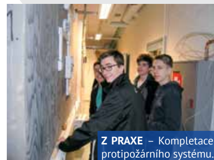
Z PRAXE – Kompletace protipožárního systému.