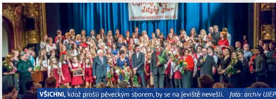
VŠICHNI, kdož prošli pěveckým sborem, by se na jeviště nevešli.