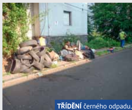
TŘÍDĚNÍ černého odpadu.