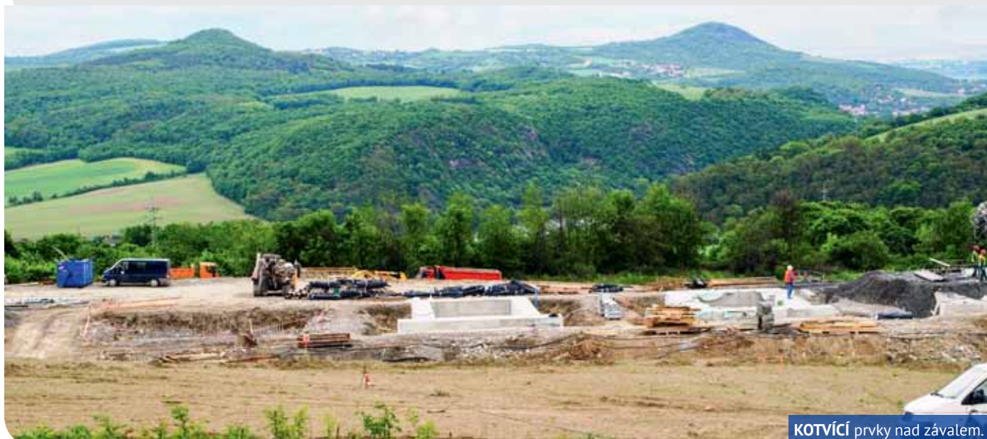
KOTVÍCÍ prvky nad závalem.