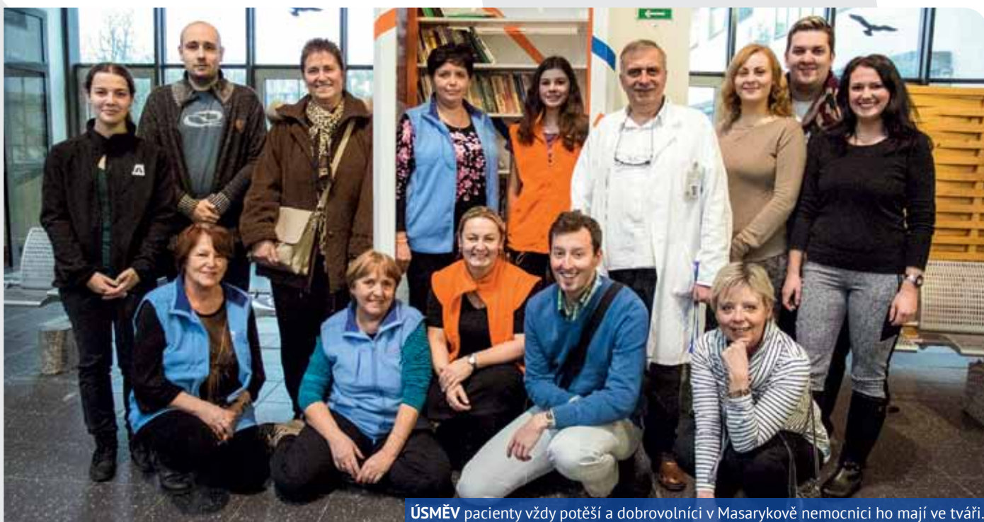
ÚSMĚV pacienty vždy potěší a dobrovolníci v Masarykově nemocnici ho mají ve tváři.

V RÁMCI VŠECH PĚTI NEMOCNIC KRAJSKÉ ZDRAVOTNÍ, A.S., LONI PŮSOBILLO 212 DOBROVOLNÍKŮ.