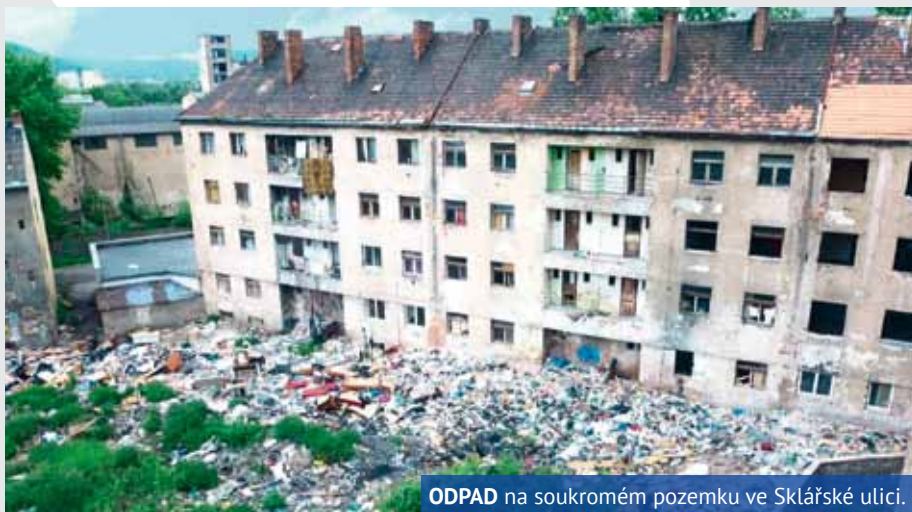
ODPAD na soukromém pozemku ve Sklářské ulici.