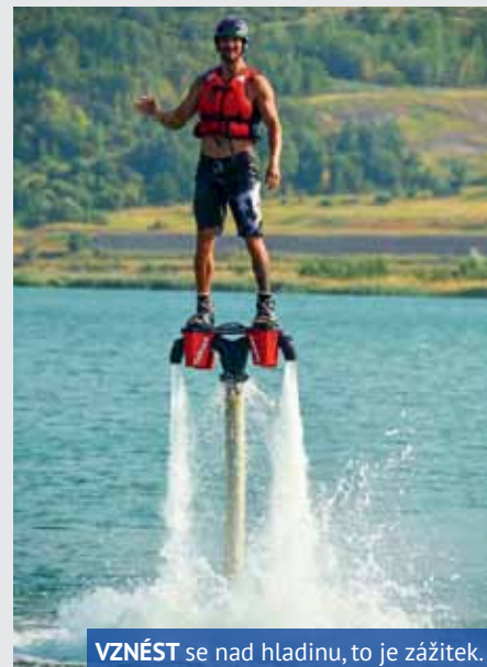
VZNĚST se nad hladinu, to je zážitek.

Po zahájení sezóny, které proběhlo v sobotu 4. června, pozve Dobrovolný svazek obcí jezera Milada na jednu akci uprostřed léta a uspořádá i slavnostní ukončení letní sezóny. Chybět nebude například druhý ročník soutěže (ve spolupráci se společností Globus) o nejlepší burger, anebo vloni velmi úspěšná flyboardová show.