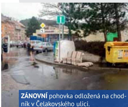
ZÁNOVNÍ pohovka odložená na chodník v Čelakovského ulici.