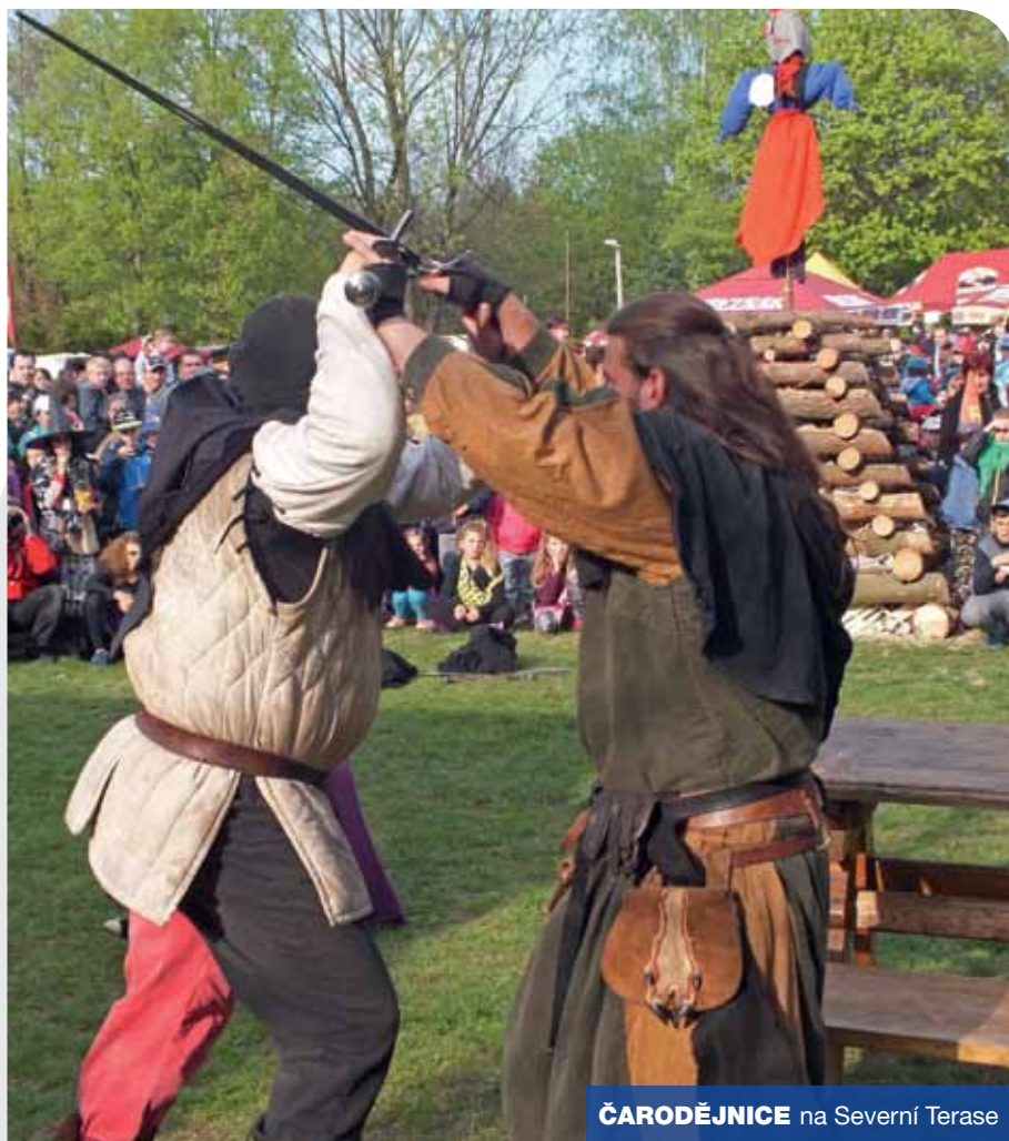
ČARODĚJNICE na Severní Terasě

Další dobrou zprávou pro obyvatele Severní Terasy je, že vedení tohoto městského obvodu se může pustit do výstavby parkoviště v ulici Stavbařů. Rada města Ústí nad Labem schválila na tuto investici částku dva a půl milionů korun.