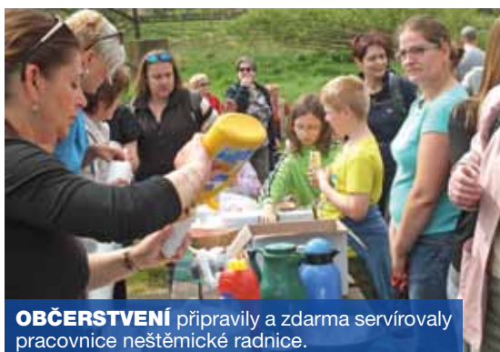
OBČERSTVENÍ připravily a zdarma servírovaly pracovnice neštěmické radnice.