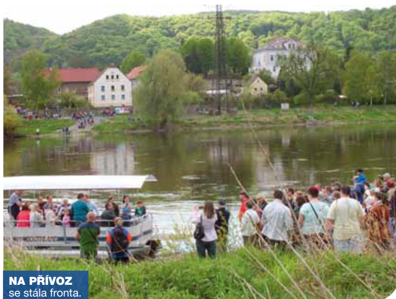
NA PŘÍVOZ se stála fronta.