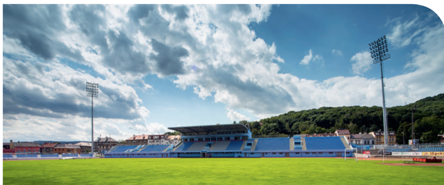
MRAKY nad ústeckým fotbalem chce město rozehnat

Podíl statutárního města Ústí nad Labem je zhruba 77 %, dvaadvacet procent patří FK Teplice, ten se však ani na dotacích, ani na ztrátách nepodílí. Základní kapitál FK Ústí nad Labem byl stanoven na 4,5 milionu korun, nyní ale kapitál klubu tvoří necelý milion korun. Neznamená to, že by FK Ústí nad Labem byl v insolvenční, tedy že by měl závazky, které nedokáže vykrýt. Problémem ovšem je, že jeho základní kapitál je neustále v mínusu. V této chvíli je na stole žádost FK Ústí nad Labem o dotaci v hodnotě 2,2 milionu právě na pokrytí základního kapitálu. Budeme se snažit najít vhodnou cestu, jak FK Ústí nad Labem pomoci.