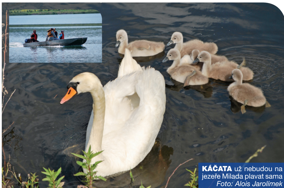
KÁČATA už nebudou na jezeře Milada plavat sama

Zázemí pro pláž a další místa v okolí jezera budou vybavena jak nádobami na odpad, tak mobilními WC, zajištěn bude i úklid. V průběhu sezóny budeme sledovat, zda dostatečně. Pokud by se ukázalo, že ne, tak počet nádob i frekvenci úklidu zvýšíme. A samozřejmě budeme rádi, pokud okolí jezera zůstane příjemným místem pro odpočinek obyvatel