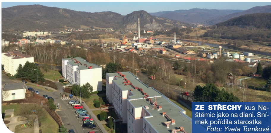
ZE STŘECHY kus Neštěmic jako na dlani. Snímek pořídila starostka