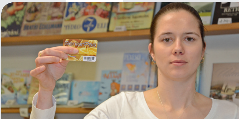
SENIOR PAS lze po zaregistrování získat v Informačním středisku města v Paláci Zdar.