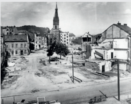
Ulice Malá Hradební , v pozadí kostel Nanebevzetí Panny Marie