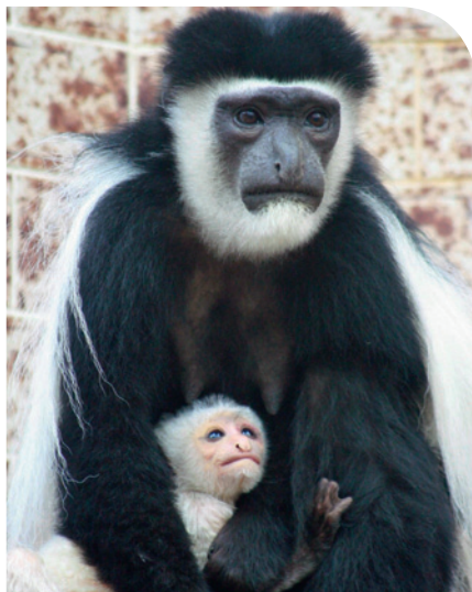
PRVNÍ MLÁDĚ roku 2015: gueréza pláštíková

Už se ví, kdo nahradí lachtana Moritze? To, že chov lachtanů – v té podobě, v jaké tu byl – u nás pokračovat nemůže, jsme doufám lidem vysvětlili. Lachtani žijí v harémech (jeden samec a větší počet samic) a tomu musí odpovídat i prostor, v němž se zvířata chovají. Starý pavilón je malý, stavba nového by přišla na padesát – šedesát milionů korun. A museli bychom ho přestěhovat na úplně jiné místo. Jaké máme záměry s pavilónem, který po lachtanovi zůstal? Mohl by být využit pro chov tučňáků, úpravy by přišly na dvanáct až patnáct milionů korun. Jako další možnost se nabízí zřídit zde chov mořských vyder. Mořská vydra je velice ohrožený druh. Programy na její záchranu jsou nejrozvinutější v USA, kde ročně zachrání přes osm set vyder.