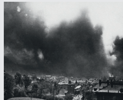
Bombardování Ústí nad Labem 17. 4. 1945