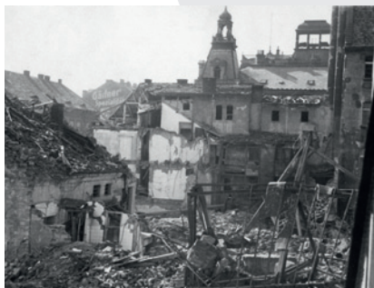
Pohled z ruin budovy knihovny na dnešním Lidickém náměstí směrem k bývalé poště v dnešní Revoluční ulici