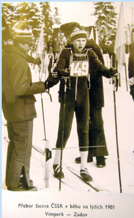
Přebor Žactva ČSSR v běhu na lyžích 1981 Vimperk - Zadov

„Běhání na lyžích je samotářský sport. V poslední době se snažím být v kolektivu, propadl jsem golfu, miluju tenis a zahraju si i volejbal a basket. Studoval jsem aprobaci tělesná výchova - zeměpis, takže se vši skromností říkám, že se ke sportu umím postavit. Na překlenutí těch telecích let je sport ideální. Přál bych si, aby moje děti sportovaly. Nebudu je tlačit, rodiče mě taky netlačili. Tehdy jsem chtěl být sám nejlepší, jako teď v dalších činnostech svého života.“