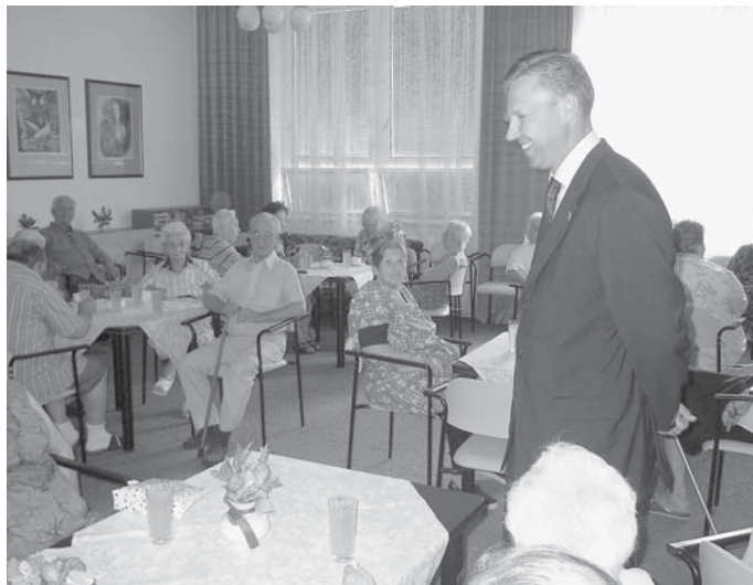
Primátor hovoří se seniory v chlumeckém domově důchodců.

Rada seniorů bude primátovi města předkládat doporučení směřující k aktivnímu životu seniorů - společenskému, kulturnímu, vzdělávacímu a sportovnímu. Dále bude řešit otázky sociální a zdravotní politiky, bydlení, dopravy, bezpečnosti, životního prostředí či rozvoje města. „Na jednání o vymezení činnosti Rady seniorů jsme se rovněž dohodli, že tato rada bude rozvíjet svou činnost na základě svých požadavků, ale záro-