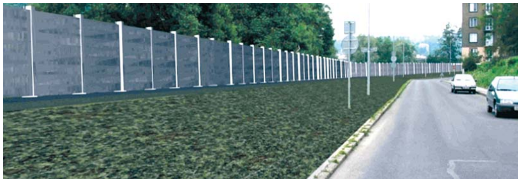
Na jeden metr vysoký val bude v případě potřeby umístěna mobilní protipovodňová stěna.

Ochrana Střekova má spočívat v navýšení nábřeží o jeden metr vysoký val. Na jeho vrcholu bude umístěno kotvení