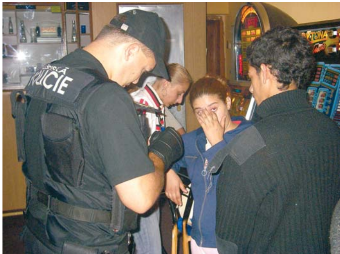
Kontrola dokladů v krásnobřezenské herně U draka.

V ústeckých hernách i přímo na ulici byly zkontrolovány doklady desítek osob. U žádné z nich nebylo prokázáno porušení zákona. „Mám z toho velkou radost. Objeli jsme herny