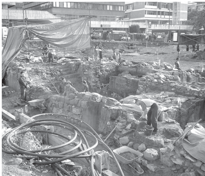
Práce na vykopávkách na ploše bývalého parkoviště u budovy spořitelny mají být ukončeny na podzim.

Primátor Ústí nad Labem nechce zmíněným stanoviskem zpochybnit či snížit význam archeologického průzkumu v centru města. „Když jsem se dozvěděl, že počátky osídlení Ústí můžeme zařadit do doby kamenné, tedy 4 900 – 4200 let před naším letopočtem, velice mě to jako laika překvapilo a zároveň potěšilo. Věřím, že archeologové budou na centrální ploše pracovat co nejrychleji a velice se těším na konečné výsledky jejich práce.“