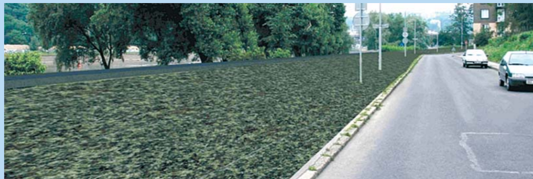
Úsek Sukova ulice – ochrana opěrnou stěnou a zemním násypem (H = 1 m) na Q4