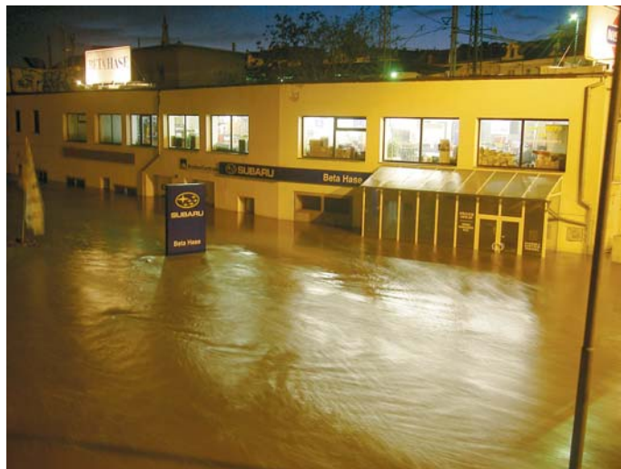
Silnice u autoservisu se zatápí jako první.