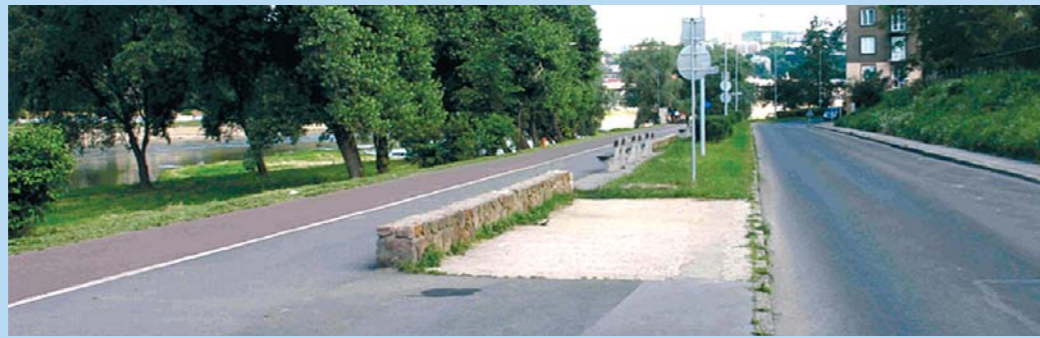
Úsek Sukova ulice – současný stav

Propočty ceny prací podle tohoto projektu předběžně vycházejí na 124 miliony korun. Projekt bude realizovat státní podnik Povodí Labe mezi svými prioritními akcemi. Pokud na něj stát uvolní peníze, stavět by se mohlo začít ještě v letošním roce.