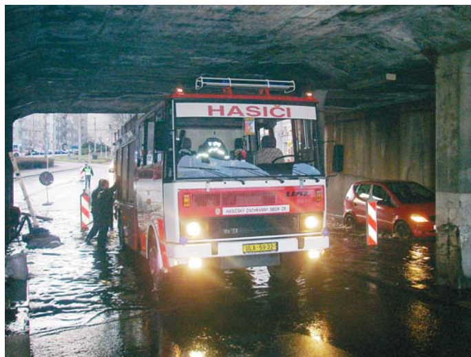
Hasiči průjezd k mostu udrželi.