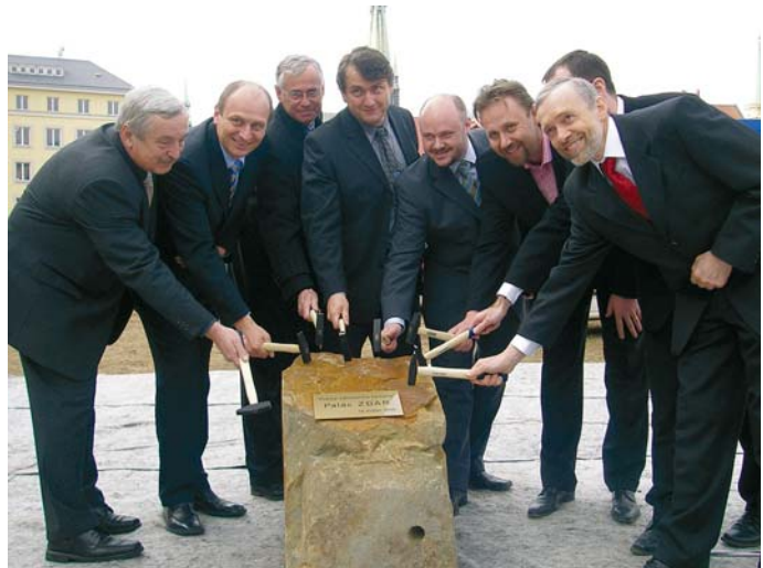
Na základní kámen Paláce Zdar slavnostně poklepali zástupci investora, města a Ústeckého kraje.