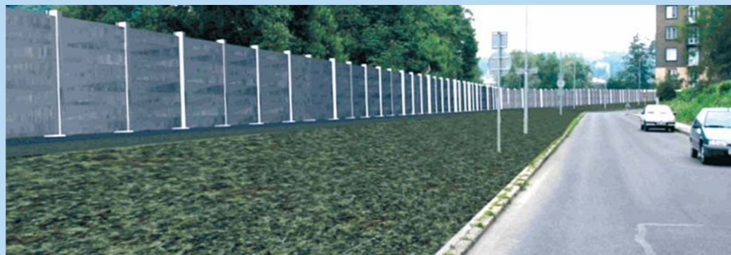
Úsek Sukova ulice – ochrana opěrnou stěnou a zemním násypem na Q4 a mobilní protipovodňovou ochranou (H = 2,4 m) na Q20