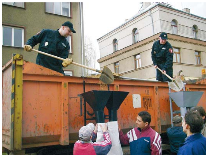
Pytlování je dřina...