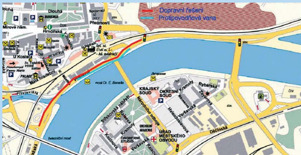
Dopravní řešení - protipovodňová hráz v Ústí nad Labem.