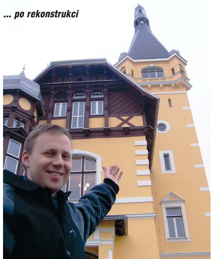
... po rekonstrukci

Na co čekáte, přijďte. Bývalá Ferdinandova vyhlídka zažívá velký návrat. Dominanta města, na kterou by ještě před několika lety většina z nás nevšlula ani zlámanou grešlí, svítí novotou.