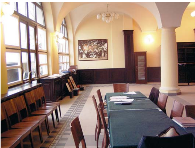
Snímek příprav restaurace z 6. prosince.

na 80 Kč a hodinová sazba hřiště na nohejbal či volejbal bude 120 korun. Parkování je bezplatné. „Chceme vrátit Větruši její původní společenský význam. Nepochybují o tom, že si sem lidé cestu najdou“, uzavírá Kubata.