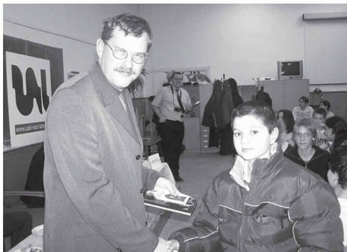
Náměstek odměňuje malého „černého pasažéra“.

„Jako černý pasažér“, pokračoval bez emocí školák. V míst-