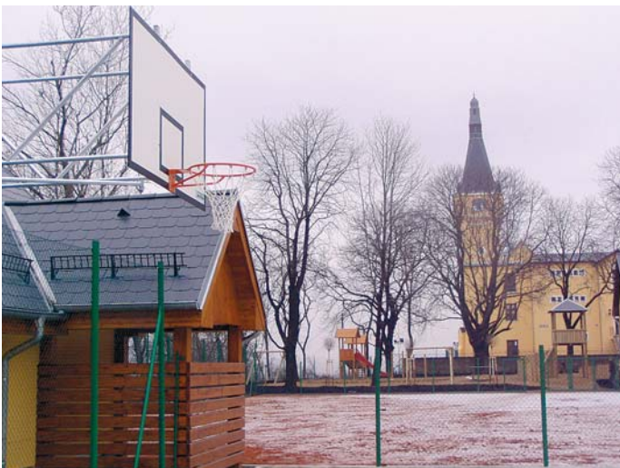
Součástí celého areálu je sportovní a dětské hřiště.