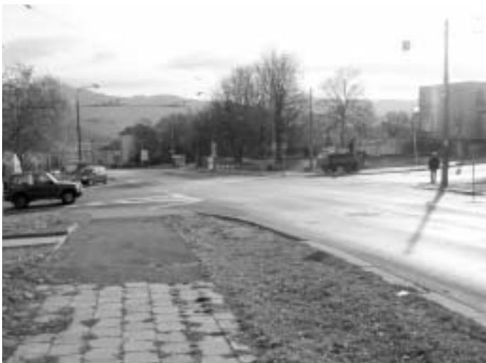
Na křižovatce Malátova - Hoření budou příští rok semaforey.

Rada města schválila harmonogram a finanční plán výstavby světelných zařízení a kruhových objezdů na území města do roku 2006.