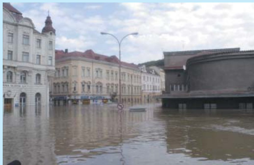
Hlavní vlakové nádraží se proměnilo v přístav.