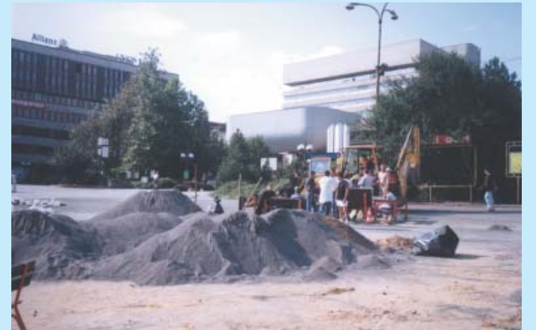
Na Mírovém náměstí pytlowały několik dní desítky dobrovolníků.