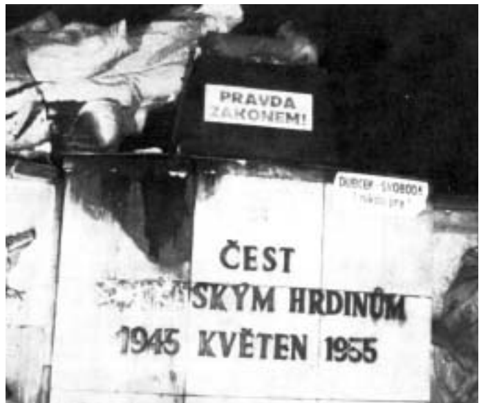
Detail poškozeného pomníku.