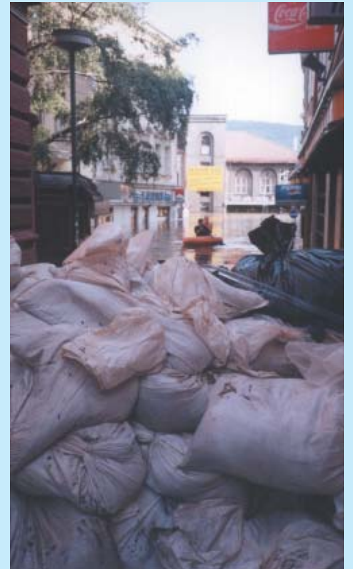
Hradba z pytlů v Jirchářích.