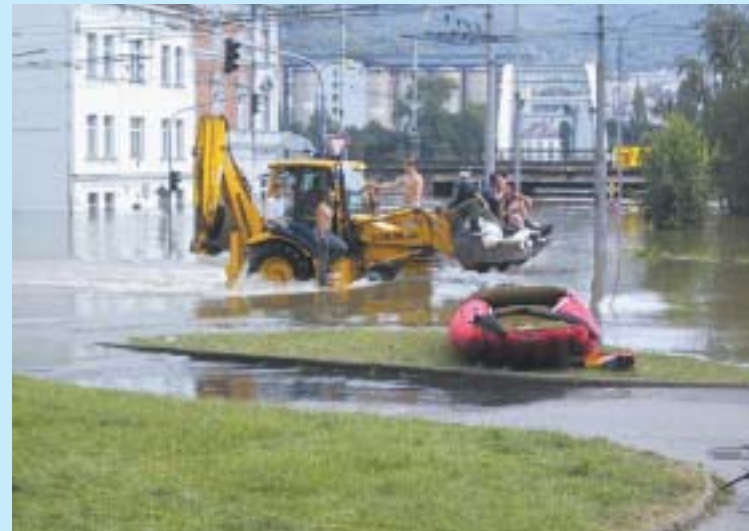
Povodňová rallye Na Předmostí.