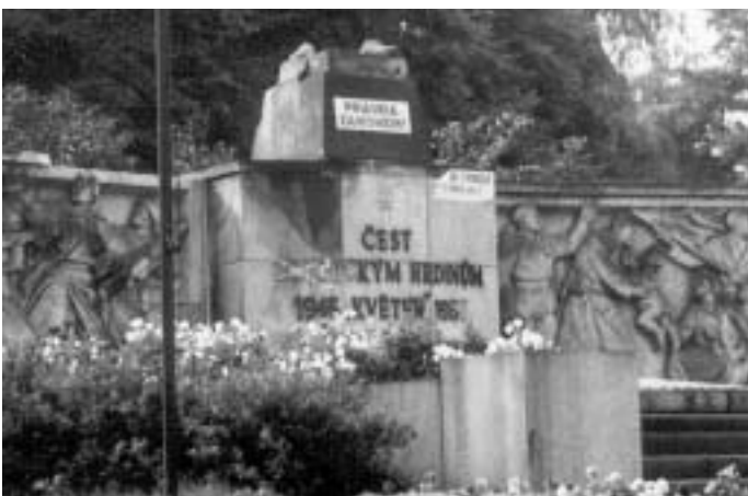
Detail poškozeného pomníku z knihy Padesát let bojů, práce a vítězství Komunistické strany Československa na severu Čech vydané v Ústí nad Labem v roce 1971.

nemocnici. Hrobku uzavírá deska z liberecké ulice, celé město. I o tom jsou nezvratné důkazy. Celé město i okres bylo během jedné noci pomalováno hanlivými nápisy a hesly, které se pečlivě udržovaly. Pomník Sovětské armády byl zdemolován a zneuctěn, vše co souviselo se stranou, se SSSR bylo ničeno, symboly přátelství a výrazu úcty k sovětskému lidu, to vše se ničilo. Jak dobře pracovala pravice v orgánech VB svědčí i to, že vyšetřování demolic pomníku Sovětské armády bylo tak dlouho oddalováno, že nakonec pachatel není konkrétně znám do dnešního dne, jsou o něm jen dohady.