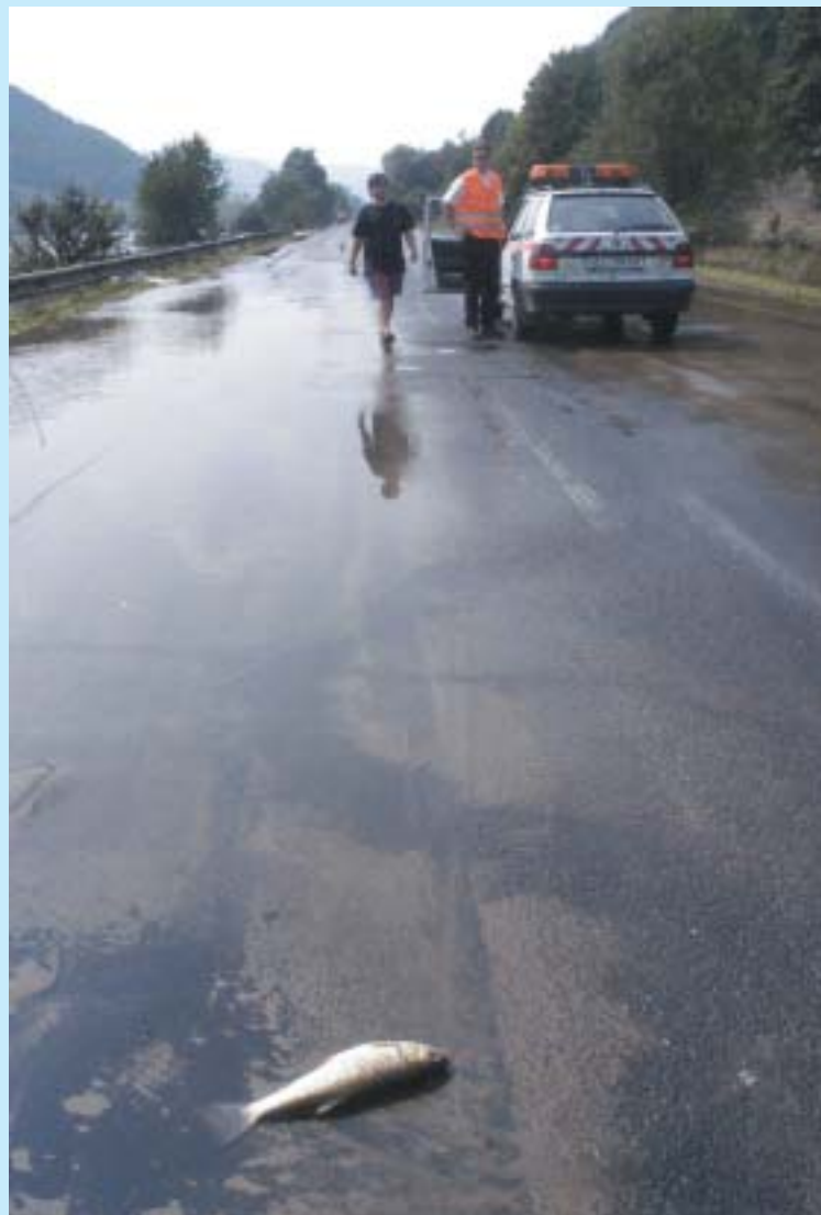
„Když mě hodíte zpět do vody, splním vám tři přání...“