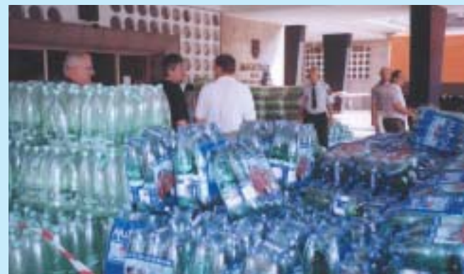
Desetitisíce litrů balené pitné vody byly provizorně uskladněny u vchodu do budovy magistrátu.