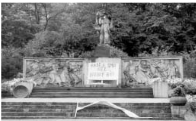
Pomník krátce po 21. srpnu 1968. Heslo „Raději smrt než otroky být“ bylo nesen v průvodu na Mírovém náměstí 21. 8.