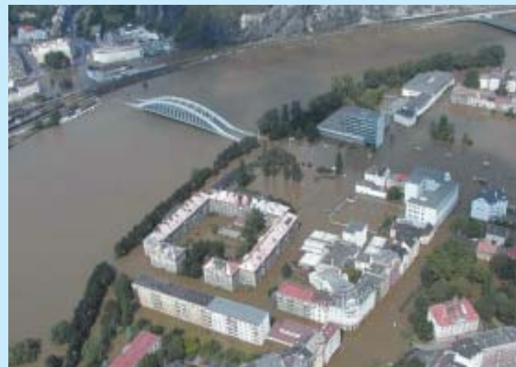
Obyvatelé Střekova utrpěli velkou vodou nejvíce.