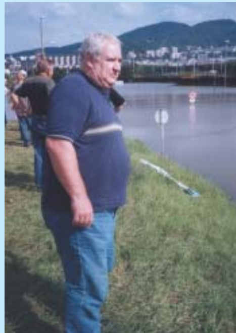
Při povodni jdou kravaty dolů. Platí to i pro primátora města.