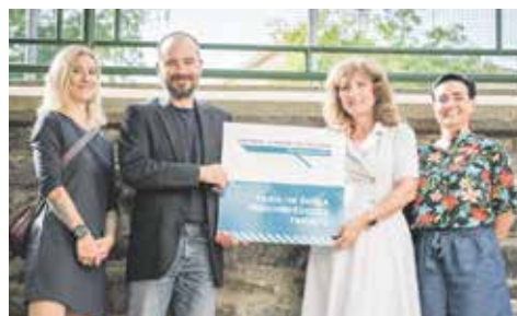
Zástupci z FZŠ České mládeže.

Spolupráce s PŘF UJEP se bude zaměřovat na zkvalitňování výuky informatiky, fyziky, zeměpisu, biologie, matematiky a chemie. Kromě jiného zahrnuje i společnou práci v projektu MŠMT Pokusné ověřování systému podpory provázejících učitelů. Cílem tohoto pokusného ověřování je realizovat, ověřit a vyhodnotit podporu provázejících