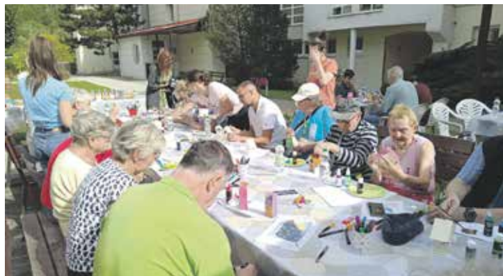
Zdobení ptačích budek v rámci Tvořivého dne pro seniory.

Mírové náměstí zaplnil Den pro zdraví a udržitelnou mobilitu. Mnozí návštěvníci využili bezplatného poradenství a měření u stánků zdravotních pojišťoven, škol a dalších organizací nebo se zastavili u interaktivní výstavy „Každý svého zdraví strůjcem“, kterou přivezla Liga proti rakovině. Informace o chystané vysokorychlostní trati z Prahy do Ústí nad Labem a Drážďan podávali odborníci ze Správy železnic