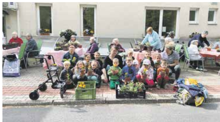
Spolupráce seniorů a dětí na přípravě květinové výzdoby.