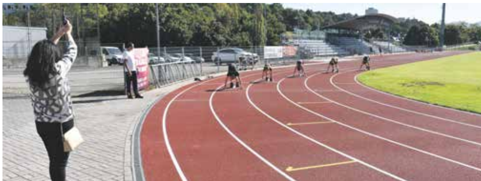
Slavnostní první běh na 200 m.

Slavnostní prohlídka k ukončení stavby na Městském stadionu proběhla koncem září. Celková rekonstrukce vyšla na necelých sedm milionů.