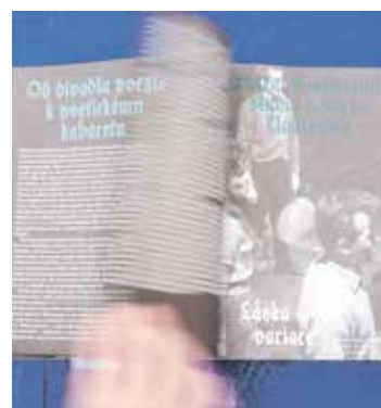
Knihy Činoherní Ústí. Ve znamení kovadliny.