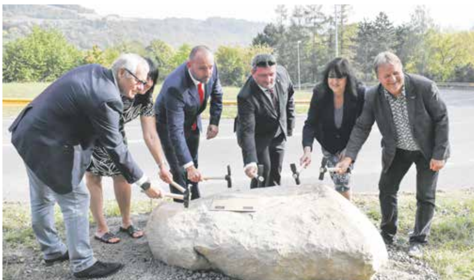
Slavnostní poklepání kamene se zástupci z řad města a firmy.

Rekonstrukce se v řešeném úseku týká i zastávek veřejné linkové dopravy Stříbrníky, Kmochova, Zoologická zahrada, Osamělá, Dvojdómí. U zastávek Zoologická zahrada, Osamělá dochází k jejich posunu. K šířkové úpravě dochází u rekonstrukce autobusových zálivů. Součástí stavby je i rekonstrukce odvod-