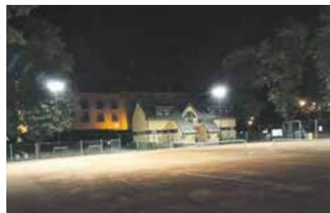
Nové osvětlení tenisových kurtů v areálu sportoviště Větruše.

Od pondělí 18. září mají návštěvníci tenisových kurtů v areálu sportoviště Větruše možnost zahrát si tenis na kurtu č. 1 nově pod umělým osvětlením. Čímž lze plně využít provozní dobu, která končí denně ve 20:00. Provoz sportoviště bude ukončen 31. října 2023.