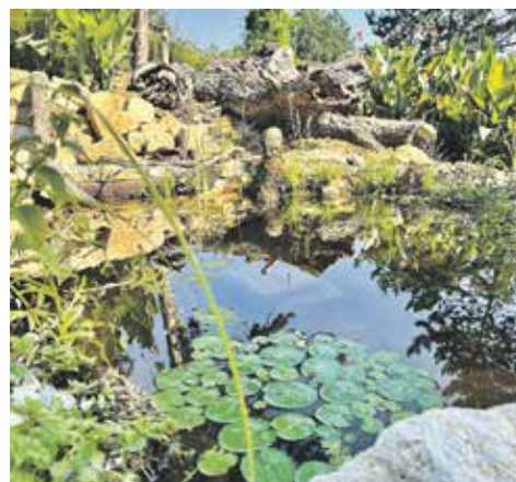
Biotopové jezírko u pavilonu Exotária.