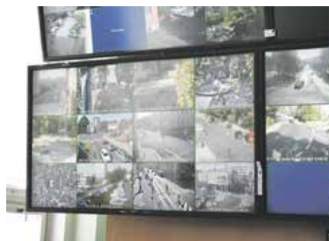
Dohledové centrum městské policie.

Jedním z hlavních přínosů implementace projektu je vybavení analytickou nadstavbou, která umožňuje detekci a vyhodnocování událostí zachycených kamerami. Tato technologie zvýší schopnost městské policie monitorovat a udržovat bezpečnost na veřejných prostranstvích