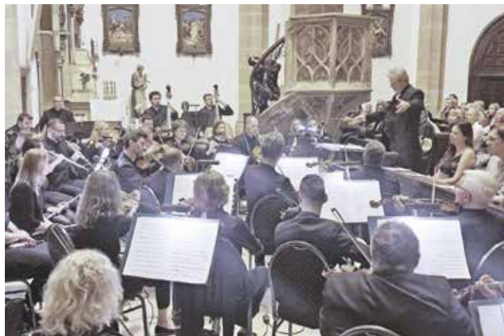
Koncert v kostele Nanebevzetí Panny Marie.