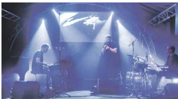
Kapela Lesní zvěř.

Sametové tóny a ohnivá vášeň se opět spojí na 27. ročníku Mezinárodního jazzového a bluesového festivalu v Ústí nad Labem! Po roce se do Národního domu vrací tradiční akce, která téměř tři desítky let představuje legendy i čerstvé novinky.