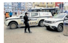
Z deníku městské policie