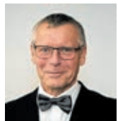
Petr Nedvědický primátor Ústí nad Labem