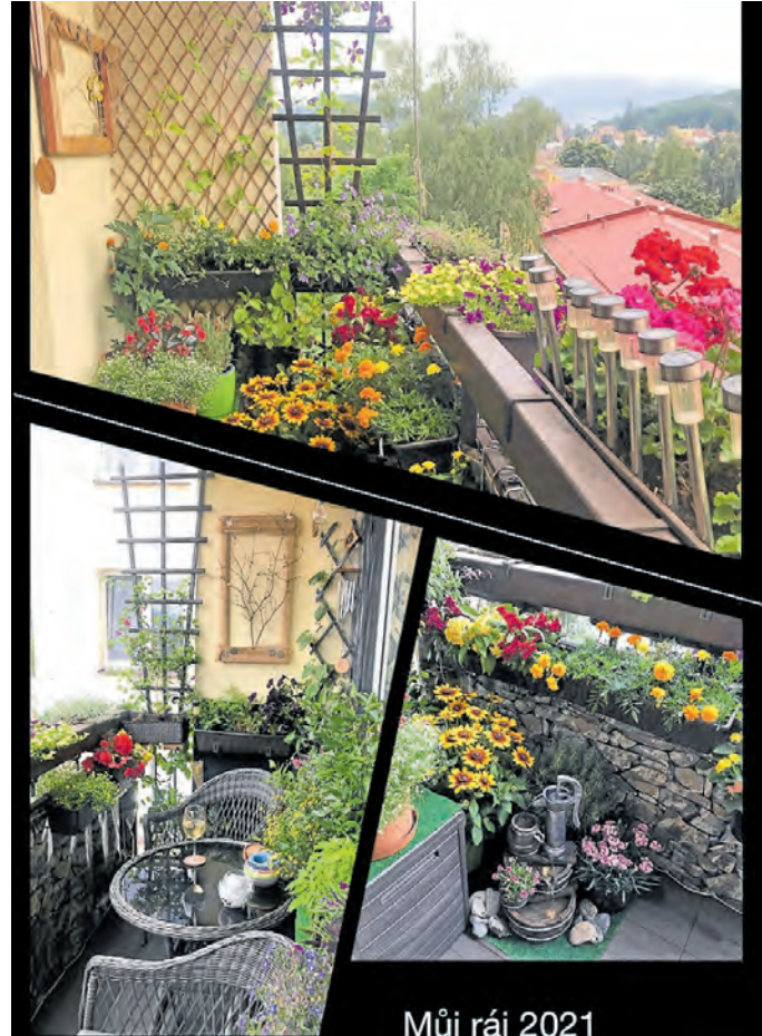
Můj ráj 2021