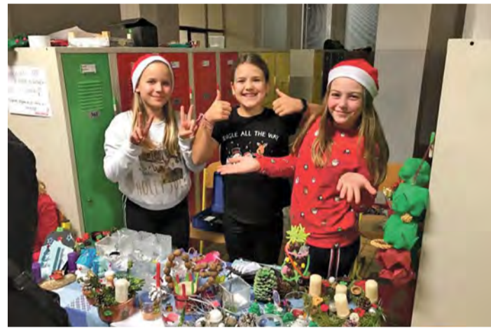
Žáci se na vánočním trhu dobře bavili

Jaroslava Štofíková učitelka ZŠ Stříbrnická