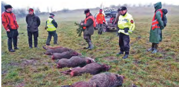
Při nahánce bylo uloveno sedm divočáků

Dopolední nahánka divokých prasat se uskutečnila nad Mariánskou skálou poblíž centra města. Nahánky se zúčastnili vedle myslivců ze sdružení Diana i strážníci městské policie, kteří během lovu usměrňovali dopravu, dohlíželi na bezpečnost a na to aby do prostoru nevstupovaly nepovolené osoby a nedošlo k jakémukoli zranění. Během tohoto odstřelu bylo uloveno sedm divočáků.