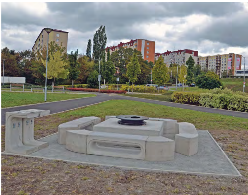
Venkovní gril slouží občanům na Severní Terase

Projekty musí projít dle zásad participativního rozpočtu posouzením odborné hodnotící komise, která rozhodne o realizovatelnosti podaných projektů. O těchto realizovatelných projektech bude rozhodovat také veřejnost formou