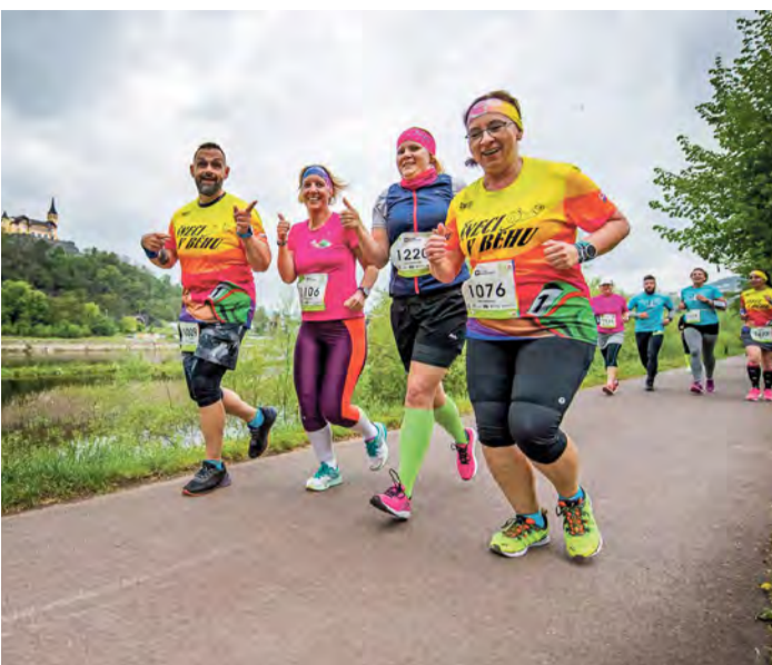
Závod přivede běžce na břeh Labe

Omezení v dopravě čekat hlavně před krajským soudem