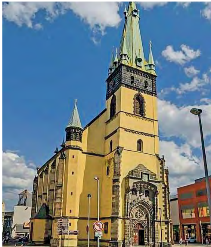
K Ústeckým NEJ patří i nejšikmější věž kostela ve střední Evropě

Víte, kde se vyráběly první české žiletky, kde se narodila panička nejslavnější lvice světa Elsy Joy Adamsonová anebo odkud vzešla legendární Fidorka? To všechno se dočtete v knize Opavská NEJ, která je nejčerstvější novinkou knihovny Muzea města Ústí nad Labem.