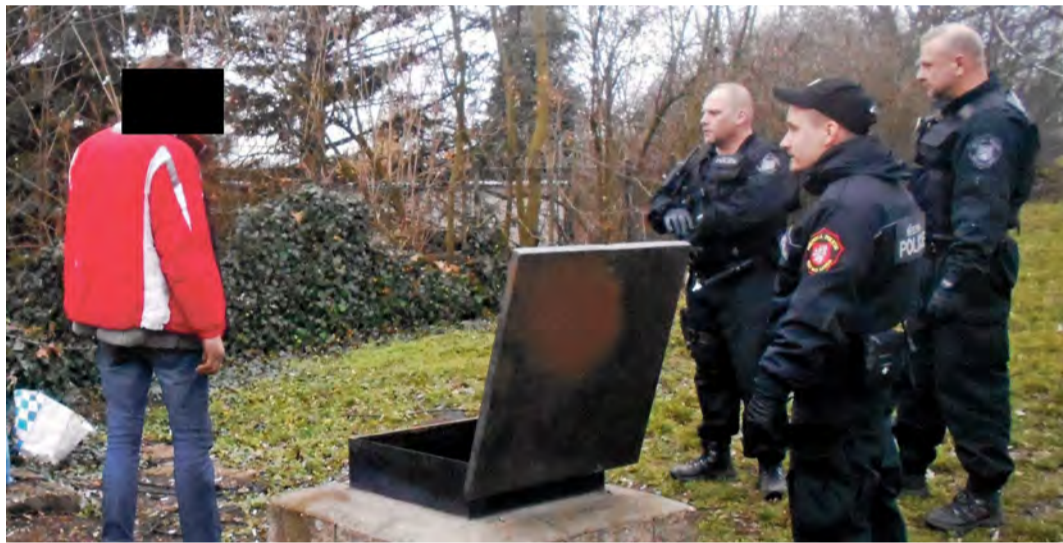
V kolektoru bylo osm pytlů odpadků

Ve dvou případech strážníci zjistili osoby, které v ulici Sociální péče neoprávněně přebývaly v tepelném kolektoru. I zde zbyl po nezvaných hostech značný nepořádek. Ten se vešel do osmi pytlů, které byly odvezeny. Oba muži byli z místa vykázáni. „Nepořádek v ulicích občanům velmi vadí, proto budeme v těchto opatřeních pokračovat i nadále,“ poznamenal primátor Petr Nedvědický.