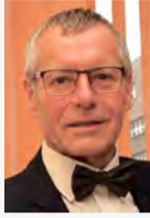
Petr Nedvědic primátor Ústí nad Labem