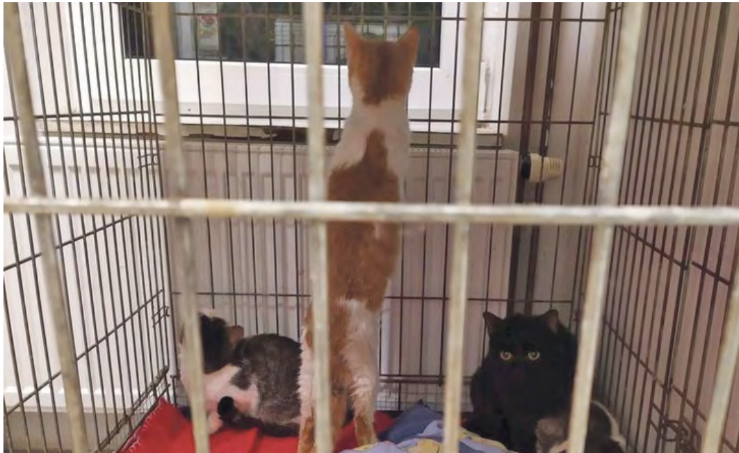
Kočky žily v bytě v otřesných podmínkách

Strážníkům se za asistence veterinářky a pracovnice spolku Felisi CAT z bytu podařilo zachránit 22 koček, které byly hlídkou odvezeny do městského útulku pro opuštěná zvířata. Dále se na místě nacházelo 16 uhynulých koček, některé byly i v mrazicím boxu. Strážníci je posbírali do igelitových pytlů a odvezli do kafilerie ústecké ZOO. Případ vyšetřuje Policie ČR pro podezření z trestného činu týrání zvířat.