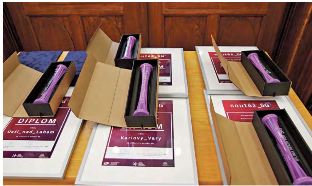
Město získalo cenu v soutěži Ministerstva průmyslu a obchodu a Ministerstva pro místní rozvoj

Nasazení 5G sítě v Ústí nad Labem umožní například provozovat tzv. U Smart Zónu pro vývoj a testování autonomních (bezpečných) systémů aut v městském provozu a také podstatně rozšířit uplatnění datové platformy